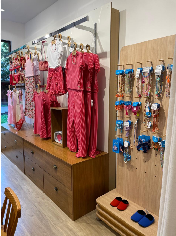
Roupas e acessórios L'Été.

O setor de beachwear infantil no Brasil enfrenta desafios relacionados à elevada concorrência e à sazonalidade das vendas, que tendem a se concentrar nos períodos de verão e férias escolares (IEMI, 2025).