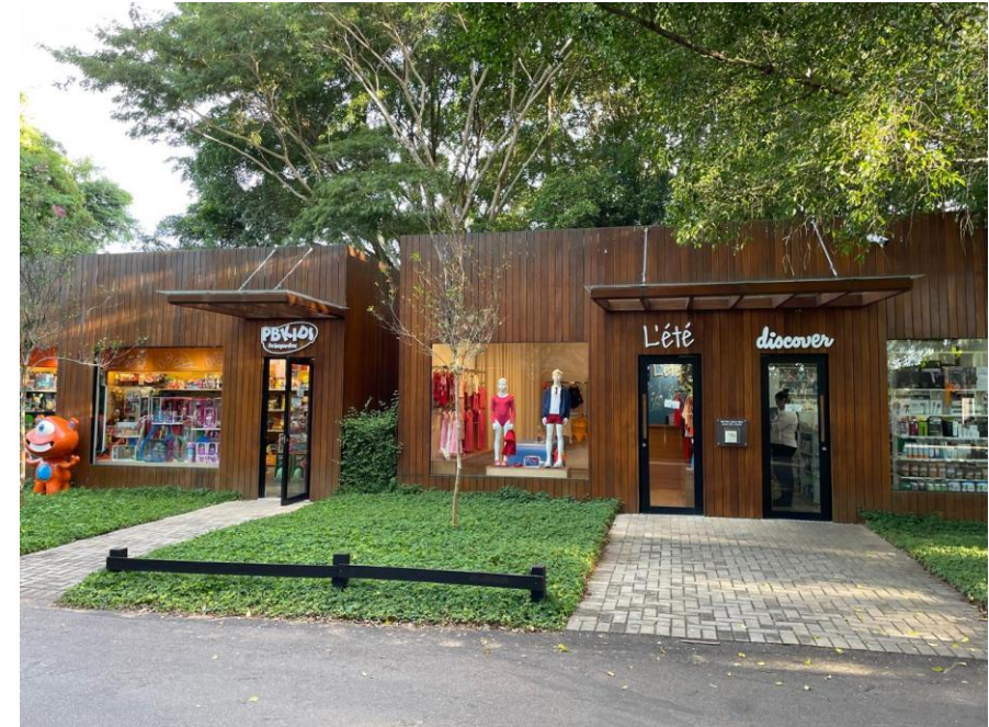
Fachada da unidade Fazenda Boa Vista.

As sociedades Recuperandas integram o Grupo L'Été, do ramo de desenvolvimento e comercialização de moda praia e casual infantil, atuante no mercado desde o ano de 2001. Sua operação ocorre no município de Porto Feliz, interior do estado de São Paulo.