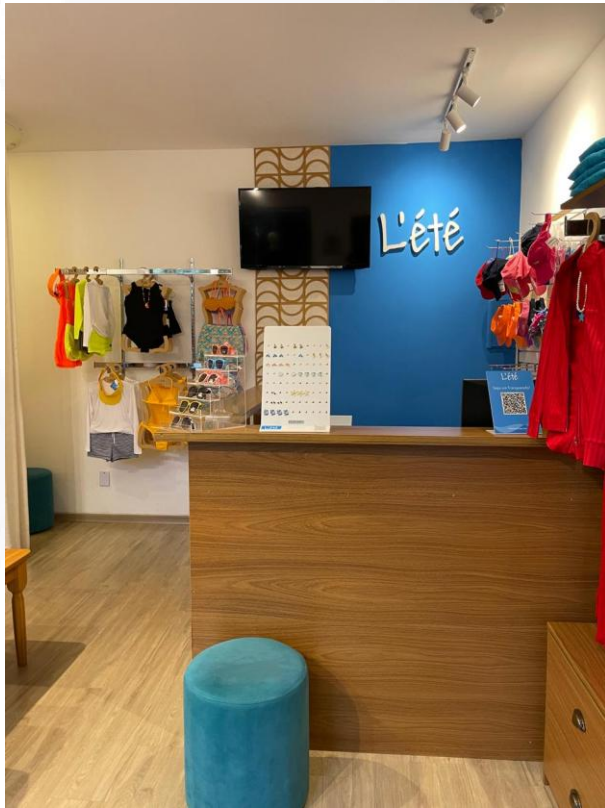
Imagens Centro Comercial na Fazenda Boa Vista.