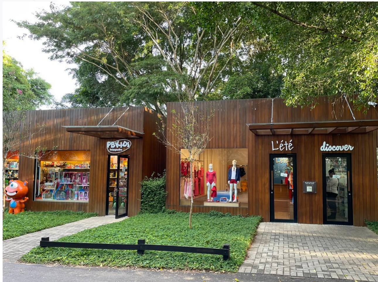
Loja L'Été na Fazenda Boa Vista..

Sendo assim, ao verificar que a administração das empresas é feita pela mesma sócia, que os endereços das empresas são os mesmos, que suas atividades registradas perante a Junta Comercial são as mesmas, é nítido que as empresas constituem um único grupo econômico, apesar de possuírem CNPJ distintos, preenchendo os requisitos do art. 69-J, incisos III e IV.