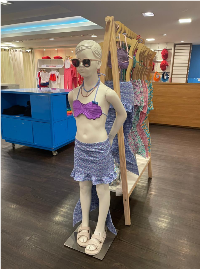
Interior da unidade Shopping Iguatemi.

Na sistemática prevista na Lei 11.101/2005, que rege os processos de insolvência empresarial, o pedido de homologação do plano de recuperação extrajudicial deve ser apresentado perante o juízo competente, que analisará o preenchimento dos requisitos legais necessários para sua homologação.