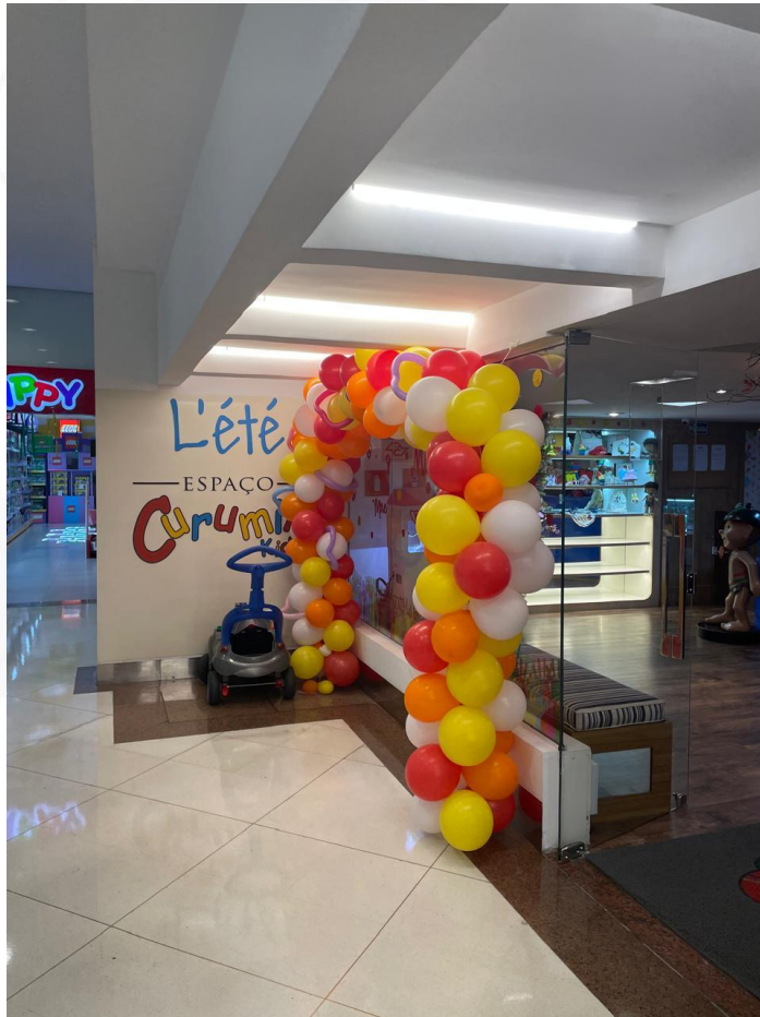
Fachada da unidade Shopping Iguatemi.

Na exposição das causas da crise econômico-financeira, as Requerentes afirmam que, apesar da relevância da marca e da consistência de suas atividades, passaram a enfrentar deterioração de seu fluxo de caixa e de seus indicadores econômico-financeiros, comprometendo a regularidade do cumprimento de obrigações no curto e médio prazo.